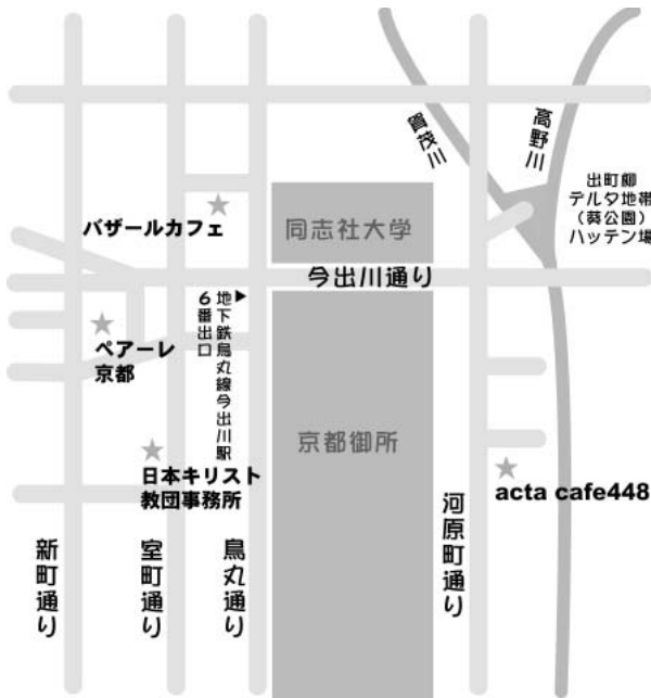
1999年9月に京都で行われた第2回研修はacta cafe448、バザールカフェ、日本キリスト教団事務所などの会場を利用し、京都のHIVコミュニティを肌で感じることができた。