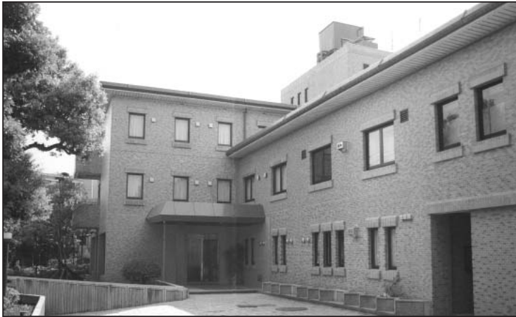
1999年12月に行われた第3回研修会場となった「KKR東京ニュー目黒」(東京都目黒区)

然のごとく力が必要となつてくる。ノンジャッジメンタルという言葉は、一つの状態を表す言葉ではあるが、それは自然発生的な状態ではなく、努力をすることによって手に入れることのできる状態であり、そのような状態へ自分を持つていくには、力を必要とする