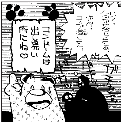
ジーマン20号『セーフアーセックスの実践』より(イラスト/平太郎)

大事なのはHIVの問題を「現場」に対して拒否感なく伝えていくことなんです。セックスを実践する人たちの感覚からかい離れた情報の流し方をしてダメなんですよ。