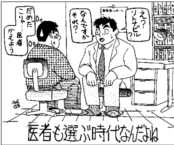
ジーマン24号「これだけは知っておきたいエイズの常識」より(イラスト/Jack住吉)

晴らしいことだと思います。そのためにはまず脚下照顧。方法論の違いでケンカしてもしょうがない。当面の大きな目標のためにまず動くべきところは動け、と。どういう戦略をとるかはそれぞれのNGOや人によって違ってくると思いますが、小さな違いは置